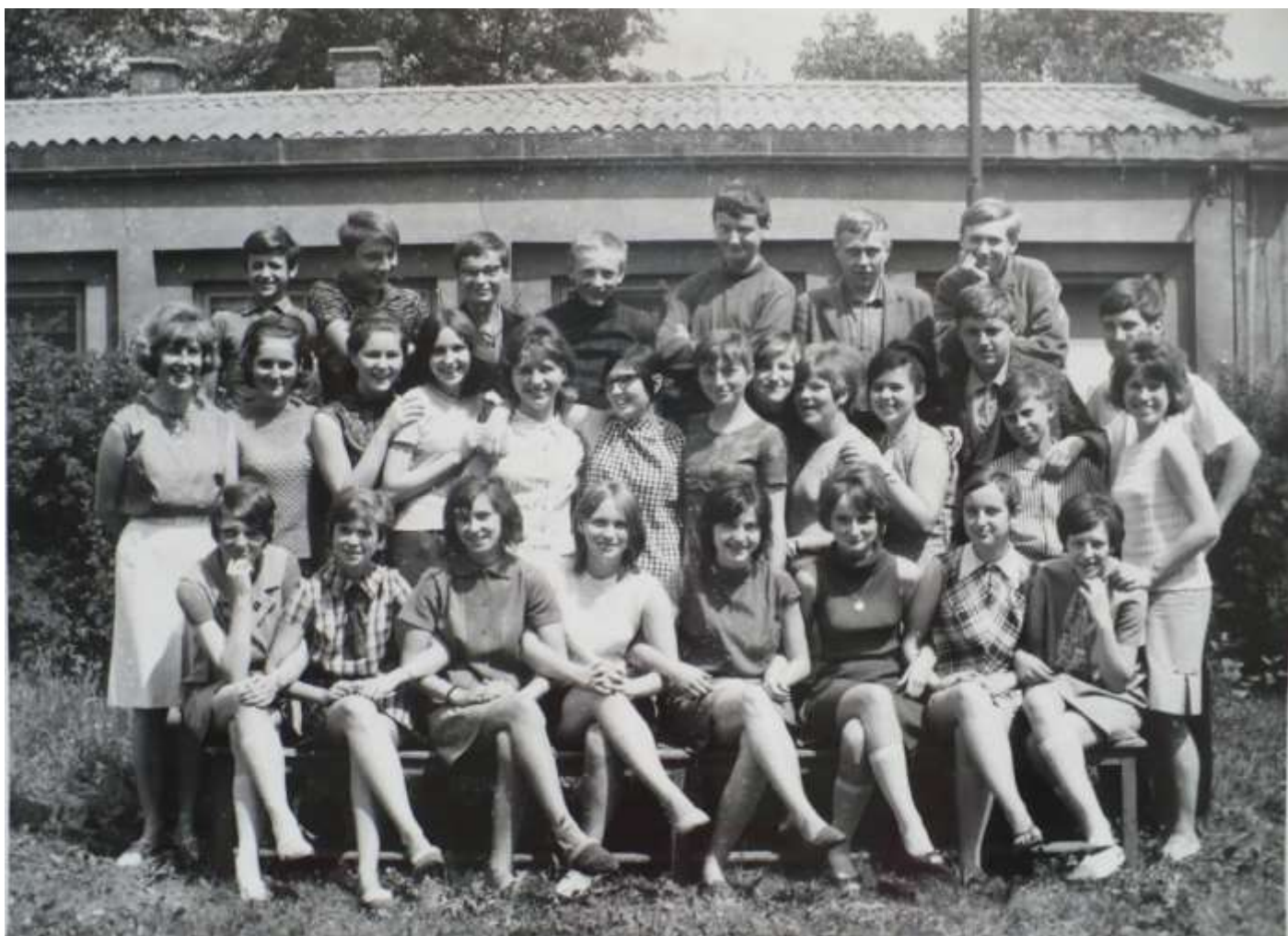
Třídní kolektiv ve školním roce 1967/1968