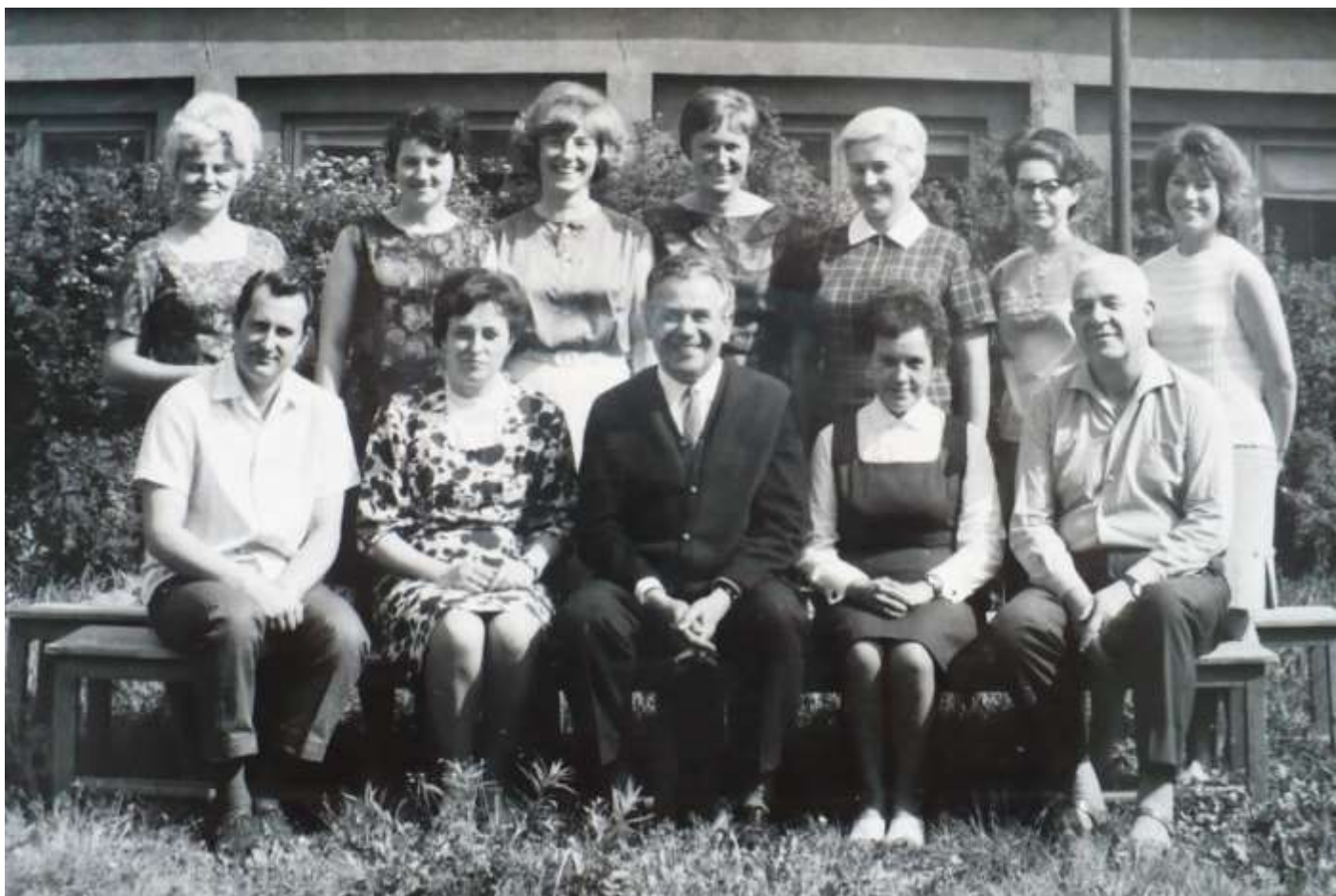
Učitelský sbor ve školním roce 1967/1968